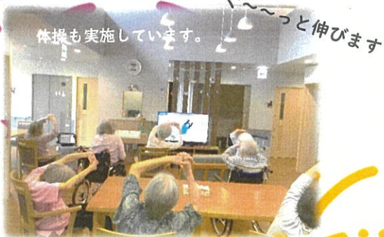
体操も実施しています。